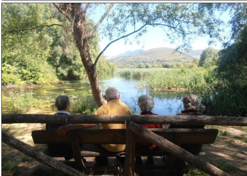
Popoli – Sorgenti del Pescara