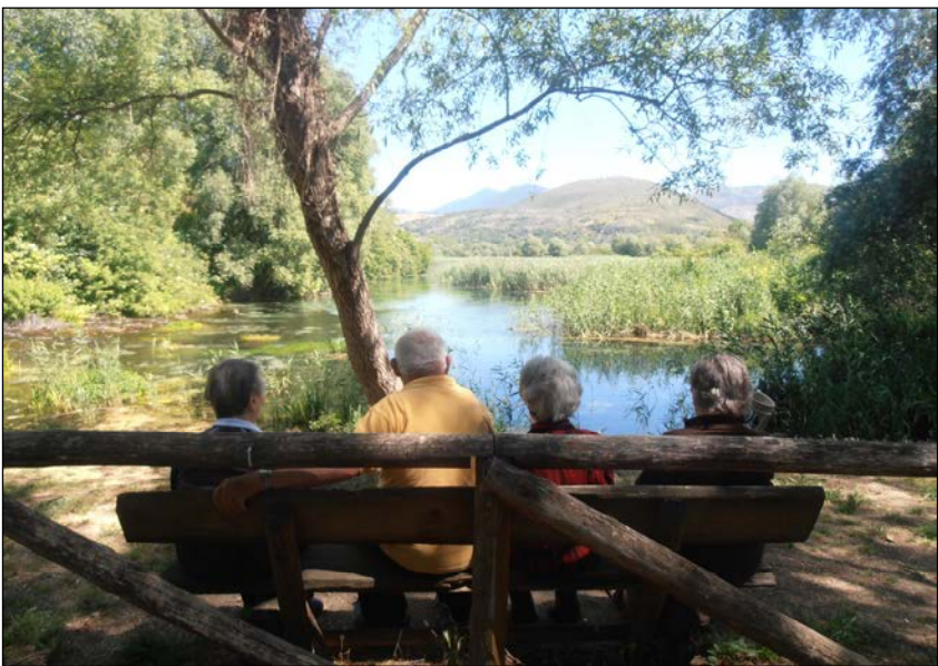
Popoli – Sorgenti del Pescara